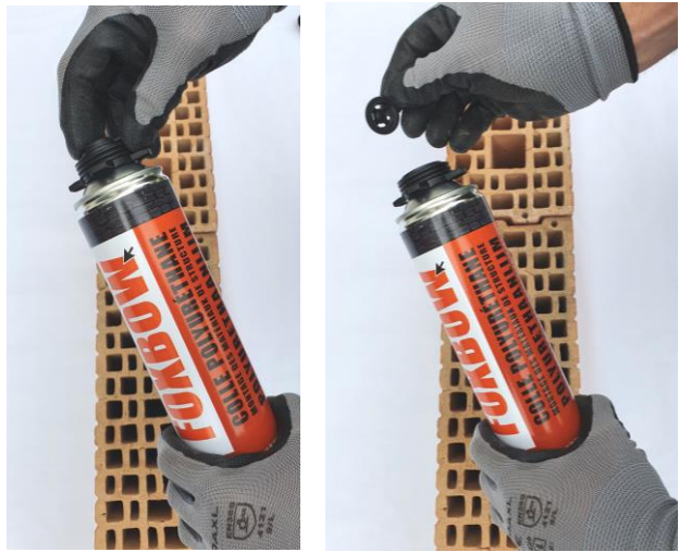
1. Verwijder de afsluiting