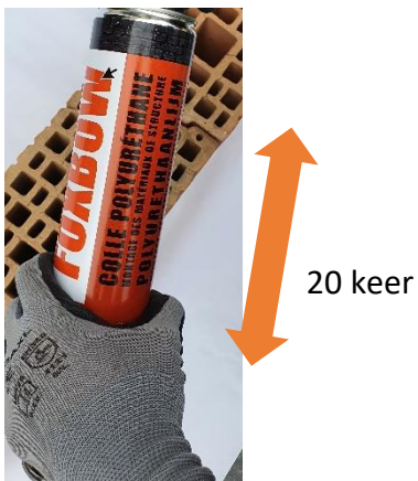
2. Schud 20 keer