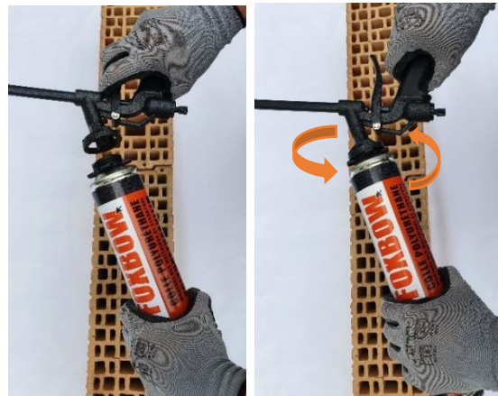
3. Schroef het applicatorpistool vast en pas het debiet aan de achterkant van het pistool aan